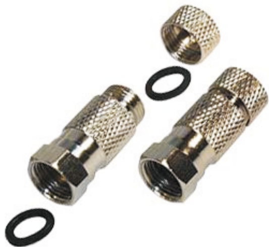
F-Adapter, Kupplung auf Kupplung

Bez.: F-Verbindungs-Set 7,5mm, wasserdichte Stecker